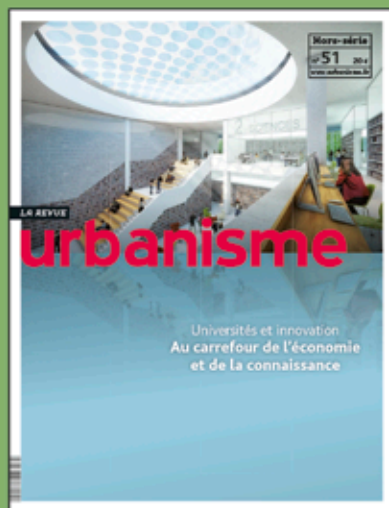
Hors-série n° 51 (décembre 2014)