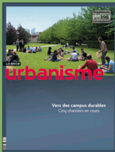
Supplément au n° 398 (octobre 2015)