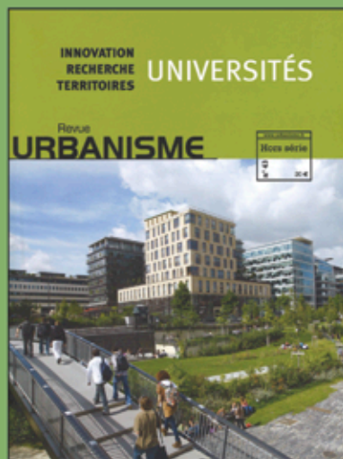
Hors-série n° 43 (novembre 2012)