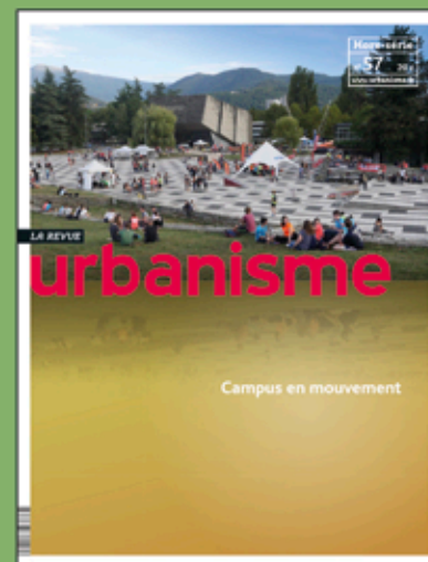
Hors-série n° 57 (octobre 2016)

5 numéros avec de nombreuses contributions de présidents d'université et de chercheurs, des enquêtes journalistiques et des points de vue politiques et de partenaires